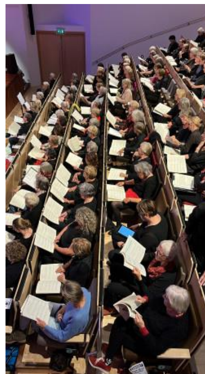
De koorleden zaten in de zaal.

Wij missen hem, zijn liefde voor de muziek, zijn betrokkenheid, zijn humor.