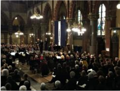
De uitvoering van de anderhalf uur durende Matteüspassie in een volle kerk Dominicuskerk

Het aanbod voor Matthäus Passion concerten is groot; de originele –Matthäus Passion- het verhaal over het lijden en de kruisiging van Jezus - is volledig gezongen en duurt ongeveer drie uur. Voor veel koorzangers een jaarlijks hoogtepunt. Maar ook voor veel zangers en brug te ver omdat zij – om vele verschillende redenen – niet in de gelegenheid zijn te studeren of te repeteren voor een uitvoering van drie uur.